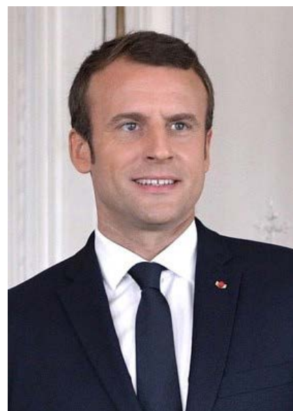
Emmanuel Macron : un jeune président à la tête de l'État français

Ainsi, à peine un an après avoir créé son mouvement En marche! , les