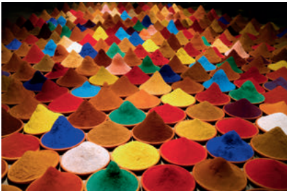
@Sonia Falcone / Hai Gallery

Sonia Falcone (*1965) Campo de Color , 2013, Tonschalen mit Pigmenten und Gewürzen (Kakao, Cayenne, Chili, Achiote, Pfeffer, Zimt, Kurkuma, Thymian, Senf ...), Installation auf der 55. Biennale von Venedig 2013, Maße: 3,5 x 10,5 Meter