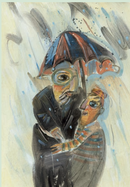
Titelillustration: Christian Smit

Dieser Ausgabe liegen Beilagen des Persen Verlags und des Publik-Forums bei. Wir bitten um freundliche Beachtung.