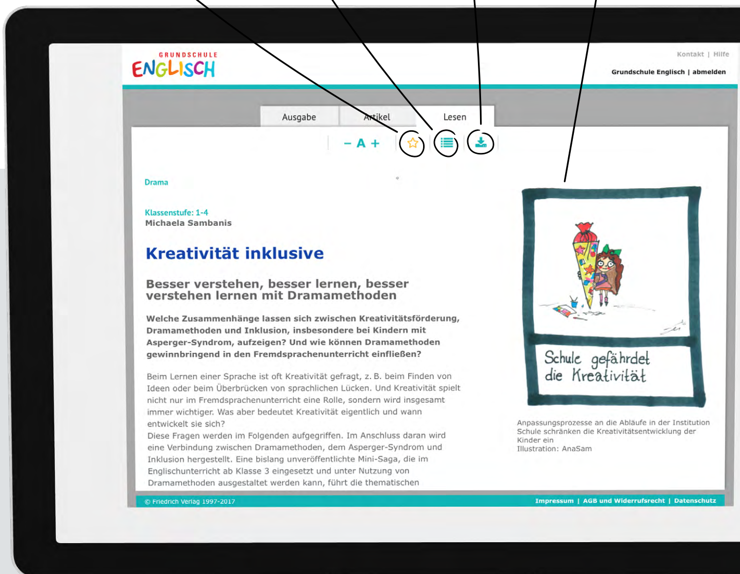
Anpassungsprozesse an die Abläufe in der Institution Schule schränken die Kreativitätsentwicklung der Kinder ein Illustration: AnaSam

Favoriten markieren Mehr Beiträge zum Thema Material einfach downloaden Abbildung zoomen