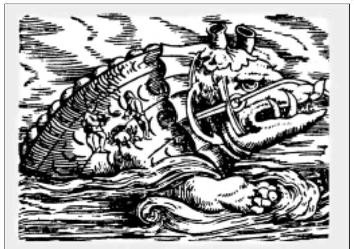
Abb. 2: Walfisch